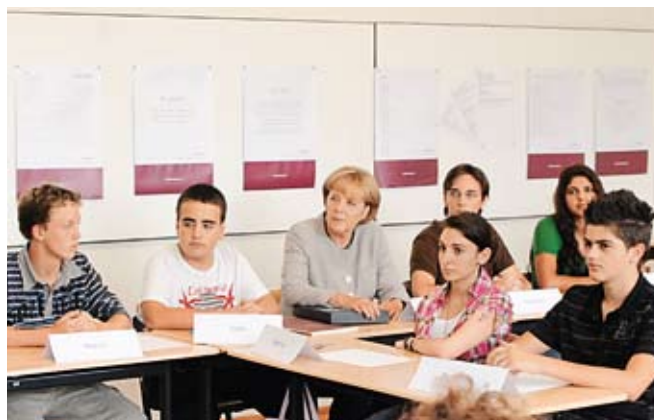
Schüler der Stuttgarter Realschule Ostheim stellten Bundeskanzlerin Angela Merkel das Literaturprojekt vor.

Projekt kennengelernt. Die Schüler schreiben Gedichte, zeichnen Comics oder üben Bühnenpräsentationen. Sie sind kreativ, die Benotung bleibt. Beim bundesweiten Wettbewerb »Kinder zum Olymp« erhielt das von der Robert Bosch Stiftung geförderte Projekt eine Auszeichnung in der Kategorie »Literatur«.