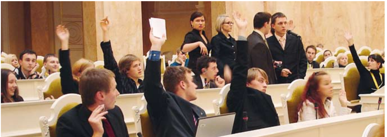
Intensive Diskussionen nach den parlamentarischen Regeln: Junge Deutsche und junge Russen scheuten kein Thema.

NACH EINWÖCHIGEN INTENSIVEN BERATUNGEN präsentierten die Vertreter des 4. Deutsch-Russischen Jugendparlaments in St. Petersburg am 2. Oktober in Anwesenheit von Bundeskanzlerin Angela Merkel und Präsident Dmitrij Medwedjew dem Schlussplenum des Petersburger Dialogs ihre Ergebnisse. Ihr Appell an den russischen Präsidenten, den deutsch-russischen Schüler- und Jugendaustausch stärker finanziell zu fördern, fand eine positive Antwort. Die 50 Jugendlichen aus Deutschland und Russland, die parallel zu den Regierungskonsultationen und dem Petersburger Dialog im Marijinskyj-Palast, dem Sitz des Petersburger Parlaments, tagten, beschäftigten sich auch mit der Kaukasus-Krise und Fragen der Zivilgesellschaft.