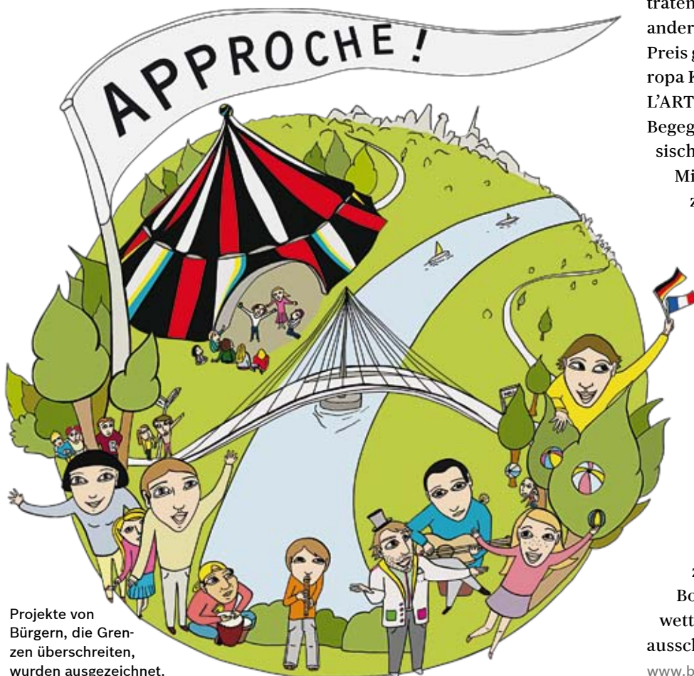
Projekte von Bürgern, die Grenzen überschreiten, wurden ausgezeichnet.