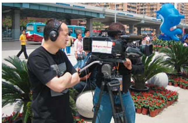
Lebhafter Gedankenaustausch beim Besuch chinesischer Diplomaten in der Robert Bosch Stiftung (Foto ganz links). Medienschaffende sind eine der Zielgruppen der Förderinitiativen zur Stärkung der deutsch-chinesischen Beziehungen (Foto links).

beziehungen zwischen Deutschland und China sein. Mit der »Wissenschaftsbrücke China« wurden in knapp 50 Fällen die ersten Schritte gemeinsamer deutsch-chinesischer Forschungsprojekte gefördert. Hier steht das Sich-Begegnen und Voneinander-Lernen ebenso im Vordergrund wie bei »Medienbotschaftern China – Deutschland«. Junge, chinesische Journalisten absolvieren einen Lehrgang an der Hamburg Media School und arbeiten danach für zwei Monate in deutschen Redaktionen. Im Frühling 2009 werden die ersten deutschen Journalisten nach Peking gehen. Mit dem »Robert Bosch Lektorenprogramm« wurden dieses Jahr erstmals vier junge deutsche Universitätsabsolventen nach Xi'an, Kunming, Nanjing und Guilin entsandt.