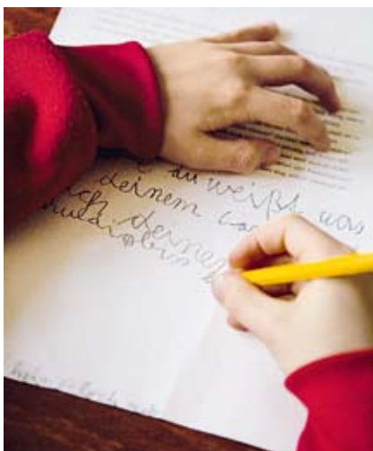
Der szenische Text für das Hörspiel stärkt Wortschatz und Sprachgefühl der Schüler.