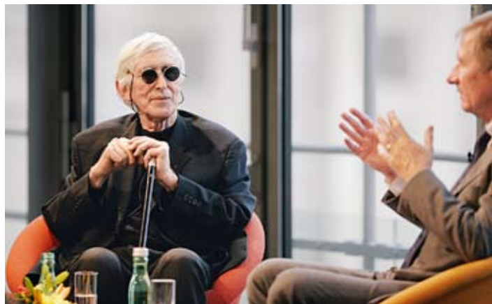
Kinderbuchautor und Zeichner Tomi Ungerer (links im Bild) im Gespräch mit Ulrich Wickert

Am 28. November 2008 wurde erstmals der »Prix de l'Académie de Berlin« vergeben. Mit dem Akademiepreis werden künftig einmal im Jahr Personen oder Projekte gewürdigt, die auf besondere Weise zur Belebung und Vertiefung der kulturellen Beziehungen zwischen Deutschland und Frankreich beitragen. Der Preis ist mit 20 000 Euro dotiert, die die Robert Bosch Stiftung bereitstellt. Als erster Preisträger wurde in Berlin Tomi Ungerer ausgezeichnet. 1931 in Straßburg geboren, wuchs der Zeichner und Kinderbuchautor in einer wechselhaften Zeit im Elsass auf – diese Erfahrung machte ihn zum Brückenbauer zwischen Frankreich und Deutschland. Sein Werk mit über 140 Büchern und mehr als 40 000 Zeichnungen findet auf beiden Seiten des Rheins viele Verehrer. Mit der Preisverleihung stellt sich die im Juni 2006 gegründete Académie de Berlin der Öffentlich-