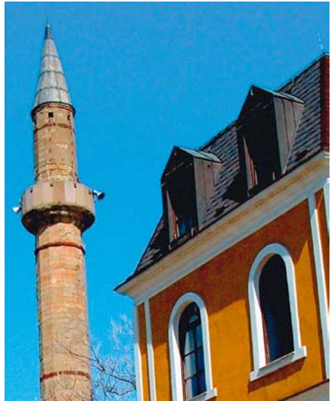
Schriftsteller, die vom Kartenprojekt gehört haben, schickten Texte und Vorschläge für Orte, die erwähnt werden sollen.

Am nächsten Morgen sitzen wir in der Bibliothek der Universität in Priština über den ersten Entwürfen. Das aktuelle kartographische Material hat Cufaj bereits besorgt, ein Grafiker kümmert sich um das Design. Viele Schriftsteller aus Priština, die von dem Projekt gehört haben, schicken uns Texte und Vorschläge für Orte, die wir unbedingt erwähnen sollen. Zwei Wochen werden wir hier arbeiten, das Land sehen, mit Menschen sprechen, Meinungen und Streit hören. Mich fasziniert das