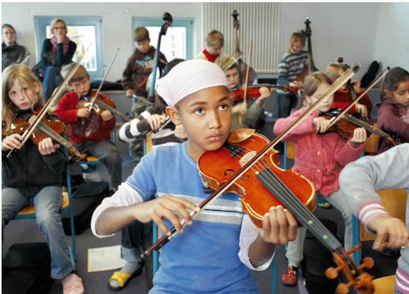
Den Deutschen Schulpreis 2008 erhielt die Wartburg-Grundschule in Münster. Sie war die erste Ganztagsgrundschule der Stadt mit Integrationsklassen, Percussion-, Streicher- und Bläserklassen und einer Grundschulwerkstatt, in der Pädagogen von- und miteinander lernen.

einem Entwicklungslabor und zu einer lernenden Organisation. Erfahrung und Können der prämierten Schulen sind Grundlage für die Arbeit der Akademie des Deutschen Schulpreises, die sich als ein Verbund exzellenter Schulen versteht, um andere auf ihrem Reformweg zu unterstützen, erfolgreiche Strategien und Instrumente der Schulentwicklung zu erforschen, zu fördern und zu verbreitern. Die Pionierarbeit solcher Schulen liefert eine Art Blaupause für die Neujustierung unseres Bildungssystems - welche Maßnahmen eingeleitet werden müssen, um das gesamte Plateau an Bildungsbeteiligung anzuheben und Zukunftsvermögen zu gewinnen.