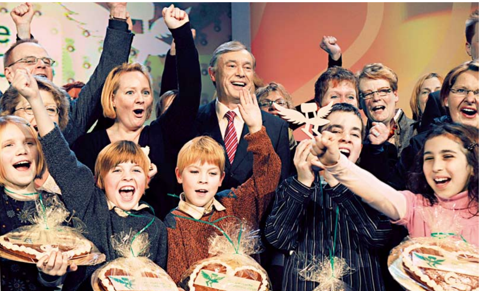
Mitte: Bundespräsident Horst Köhler überreicht den Hauptpreis des Deutschen Schulpreises 2008 an die Wartburg-Grundschule, Münster Unten: Grundschule im Grünen, Berlin; Schule am Voßbarg, Rastede; Grund-, Haupt- und Werkrealschule Altlingen, Ammerbuch (v.l.)