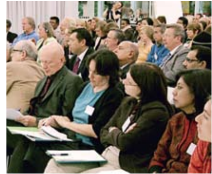
Die Tagungsteilnehmer erarbeiteten Empfehlungen für die EU-Kommission.

sollten darauf Antworten gefunden sowie Strategien und Handlungsempfehlungen für die Politik erarbeitet werden durch Vertreter aus Politik, Wissenschaft, Wirtschaft und Zivilgesellschaft aus Europa, Nord- und Lateinamerika, Asien und Afrika. Die Ergebnisse wurden an die zweite UN-Konferenz »Global Forum on Migration and Development« (GFMD 2008) übermittelt, die Ende Oktober in Manila stattfand. Außerdem entstehen aus den Tagungsergebnissen und der Studie »Die Zukunft der europäischen Migrationspolitik« von Steffen Angenendt konkrete Handlungsempfehlungen. Die »Policy Recommendations« werden der EU-Kommission