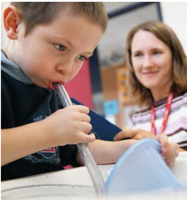
Die frühkindliche Bildung braucht mehr Aufmerksamkeit und Reformimpulse, wie mit dem Programm PiK »Profis in Kitas«.

Etliche der mit dem Schulpreis für herausragende pädagogische Leistungen ausgezeichneten Schulen haben Innovationen gewagt, um gerade solche Kinder individuell zu fördern. Sie haben es geschafft, einen Turnaround einzuleiten, aus vermeintlichen Minuspunkten Pluspunkte zu machen: statt unterrichtlichem Gleichschritt die Selbstverantwortung und Selbstorganisation des Lernens zu fördern, Lehrer zu Regisseuren von Lernprozessen zu qualifizieren, durch Teamarbeit zu entlasten und den Arbeitsplatz Schule auf Standards zu bringen, die in anderen Berufen selbstverständlich sind. Solche Maßnahmen schaffen höhere Motivation bei allen Beteiligten, erzielen bessere Ergebnisse und machen die Schule zu