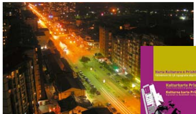
Kosovo – das Land, dessen Geschichte mit den unzähligen, nervös sich kreuzenden Meridianen der Balkan-Kulturen verbunden ist.