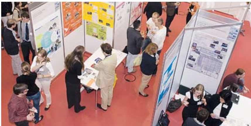
Eine Posterausstellung, Workshops und Gesprächsrunden gaben Anlass für den Austausch der Lehrer, Schüler und Wissenschaftler.