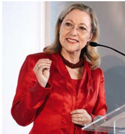
EU-Kommissarin Benita Ferrero-Waldner sprach auf Einladung der Robert Bosch Stiftung in Stuttgart.

jeder für sich in eine Krise ihrer Realwirtschaft getaumelt. Aber die EU ist nicht allein Weltwirtschaftsmacht mit einem Viertel des Weltsozialprodukts. Sie ist auch Stabilitätsspender. Was gemeinsam erreicht werden kann, war in der Georgien-Krise zu sehen. Der im Namen der Union aus-