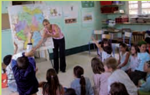
Sprachanimation mit DeutschMobil