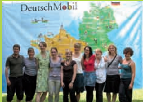
DeutschMobil-Lektoren in Frankreich