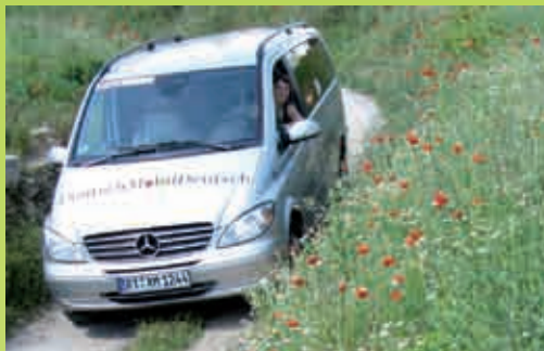
DeutschMobil in Fahrt