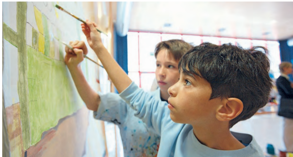
Die Förderung der Kreativität ist Ziel eines neuen Bildungsschwerpunkts der Robert Bosch Stiftung: Im Programm „KunstStück“ gestalten Grundschüler in Oberriexingen eine Bühnenwand.

Unser Blick geht aber noch weiter: Japan, China und Indien sind nicht nur wirtschaftliche Partner; auch im gesellschaftlichen und kulturellen Dialog gibt es noch Spielraum für neue Ideen. Zunächst fördern wir hier Journalisten und den wissenschaftlichen Austausch. Die deutsch-japanische Sommerschule bringt seit