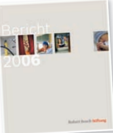
Der Bericht 2006 ist unter www.bosch-stiftung.de/publikationen im Internet einzusehen.

Der 2006 mit großem Erfolg erstmalig verliehene Deutsche Schulpreis der Robert Bosch Stiftung soll nachhaltig wirken: Vertreter aller Preisträgerschulen sind Mitglieder der Akademie des Deutschen Schulprieses. Die Akademie soll Transferort und Denkwerkstatt zugleich sein. Im Netzwerk der Besten werden vorbildliche Standards entwickelt und die Ergebnisse Bildungsverantwortlichen und Schulen selbst zur Verfügung gestellt.