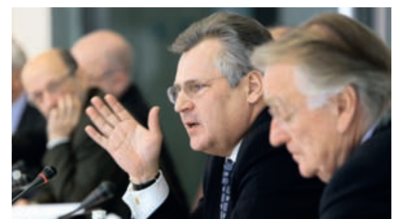
Welche Ostpolitik braucht die EU? Polens Staatspräsident a. D. Alexander Kwasniewski sucht nach Antworten.