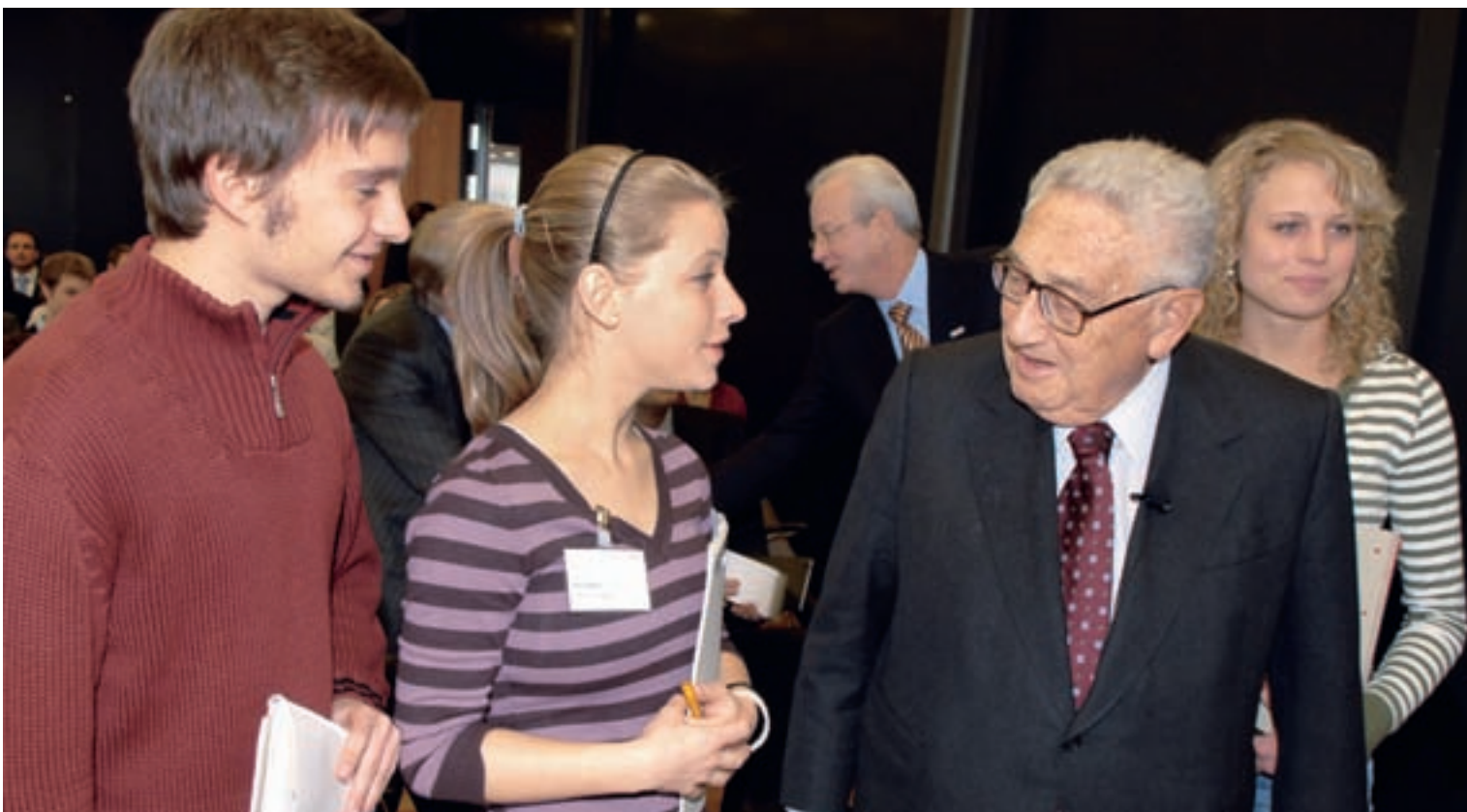
Junge Führungskräfte großer Unternehmen aus der Region Stuttgart kamen gemeinsam mit ausgewählten Studenten und Schülern am 20. März 2007 auf Einladung der Robert Bosch Stiftung zum Gespräch mit dem ehemaligen US-Außenminister Henry A. Kissinger ins Bosch Haus Heidehof nach Stuttgart. Kissingers ausdrücklicher Wunsch war es, die Meinung der jungen