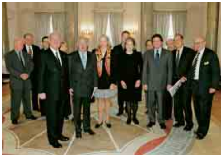
Bundespräsident Rau empfing 1999 zehn amerikanische Editors in Berlin