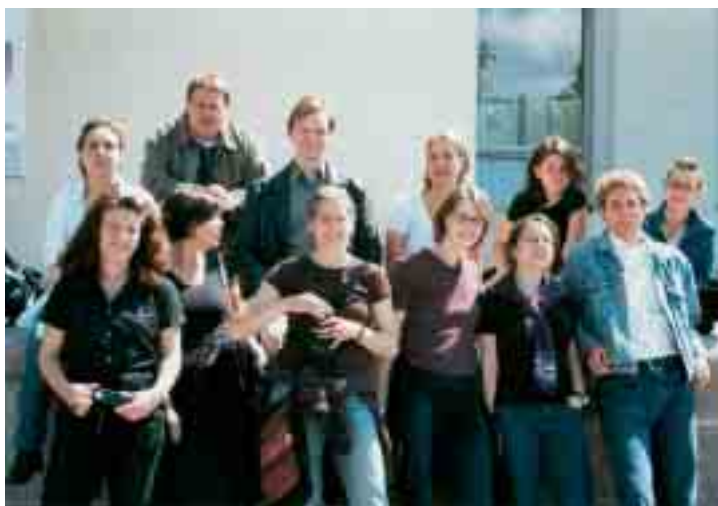
Schüler der Henri- Nannen-Journalisten- schule in Litauen

Das 1994 gegründete Open Media Research Institute (OMRI) in Prag hat den Auftrag, Informationen über laufende Entwicklungen in Ostmittel- und Südosteuropa zu sammeln, zu analysieren und weltweit zu verbreiten sowie das Verständnis für diese Länder zu schärfen. 1997 förderte die Stiftung eine vom OMRI organisierte Reise von acht Nachwuchsjournalisten aus Armenien, Rußland, Polen, Bulgarien, Rumänien und der Slowakei nach Deutschland.