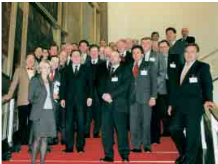
Deutsche und französische Chefredakteure 1999 in Berlin mit Bundeskanzler Schröder

Im Vordergrund der Gespräche in Paris 2001 standen die sozialen Probleme sowie die politische Lage Frankreichs vor den Wahlen. Darüber hinaus befaßten sich die Chefredakteure mit dem Stand der deutsch-französischen Beziehungen nach der französischen Ratspräsidentschaft sowie mit den Chancen des Euro. Die Teilnehmer führten ein Gespräch über die Grundlinien der französischen Außenpolitik mit Außenminister Védrine und wurden von Staatspräsident Chirac und Premier-