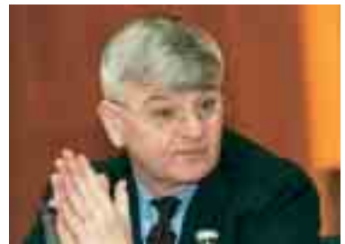
Gemeinsame Tagung verschiedener Anbieter von Journalistenprogrammen. Zur Zukunft der Europäischen Union informierte Außenminister Fischer