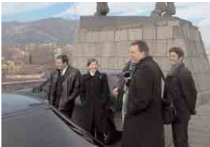
Journalisten erkundeten 2002 Tiflis

Die Resonanz der deutschen Teilnehmer auf diese erste Reise bestärkte die Stiftung, weitere Angebote dieser Art in Länder und Regionen Mittel- und Osteuropas für jeweils 15 deutsche Pressevertreter zu machen. Ziel des Programms ist es, den Teilnehmern die Länder Mittel- und Osteuropas nahe zu bringen und in kurzer Zeit einen Einblick in die Bevölkerung, Geschichte, Politik, Kultur sowie in die wirtschaftlichen Gegebenheiten zu ermöglichen. Für jeweils sieben Tage reisten die Journalisten 1997 durch Nordpolen, den russischen Oblast Kaliningrad und das westliche Litauen. 1998 führte die Reise nach Lettland, 1999 in die Tschechische und in die Slowakische Republik. 2000 hatten die Teilnehmer Gelegenheit, die Ukraine kennenzulernen, 2001 besuchten sie Estland. 2002 war Georgien, 2003 Rumänien das Reiseziel. Durch die Informationsreisen konnte der Wissens-