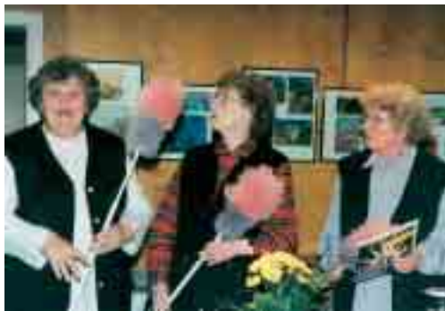
Das Seniorenkabarett der Schweriner Initiative Maglopolis

Im Herbst 1997 und 1998 lud die Stiftung Journalisten verschiedener Tages- und Wochenzeitungen aus dem Osten und Westen Deutschlands für jeweils vier Tage zu Informationsreisen ein. Die erste Reise führte nach Mecklenburg-Vorpommern und Brandenburg, die zweite nach Sachsen. Die Teilnehmer konnten sich vor Ort ein Bild davon machen, wie engagierte Bürger in Ver-