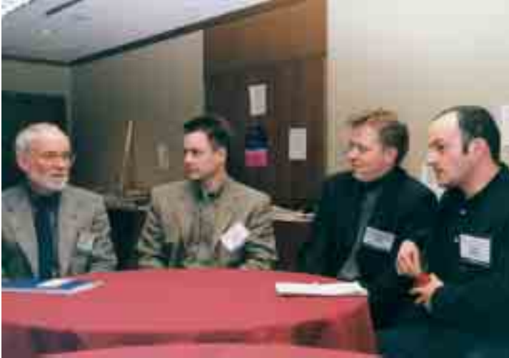
James Cornell, Präsident der Inter- national Science Writers Association im Gespräch mit deutschen Nachwuchs- journalisten.

Dem möchte die Stiftung mit einem 2001 gestarteten Programm abhelfen. Einmal pro Jahr erhalten junge Journalisten, die sich mit Wissenschaftsthemen befassen, die Chance, an ausgewählten internationalen Veranstaltungen teilzunehmen. 2002 reiste erstmals eine Gruppe junger Pressevertreter zum weltweit größten öffentlichen Wissenschaftsforum, der Jahrestagung der American Association for the Advancement of Sciences nach Boston. 2003 war der Austragungsort Denver; wieder mit Beteiligung einer Stiftungsgruppe. Die Nachwuchsjournalisten sind vor Ort nicht auf sich alleine gestellt. Erfahrene deutsche und amerikanische Kollegen unterstützen sie als Mentoren. Auch die Teilnahme an den Fortbildungen des Verbands der amerikanischen Wissenschaftsjournalisten gehören zum Programm der USA-Reise.