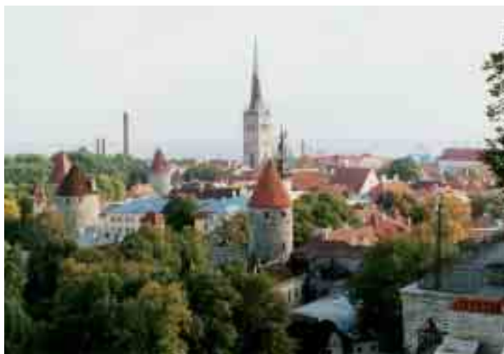
Blick auf die Altstadt von Tallinn

Ausgehend von den positiven Erfahrungen in den Schwerpunkten deutsch-französische sowie deutsch-amerikanische Beziehungen erweiterte die Stiftung das Spektrum der Informationsreisen für Journalisten auf Mittel- und Osteuropa und organisierte 1996 erstmals eine siebentägige Reise für deutsche Journalisten nach Polen. 15 außenpolitische Redakteure großer Regionalzeitungen sowie Vertreter regionaler Rundfunkanstalten ohne bisherige