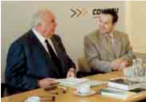
Helmut Kohl traf 2001 französische Journalisten

Zwischen 1990 und 1994 fanden die Seminare in den neuen Bundesländern statt. Dort wurde im Sinne der trilateralen Be-