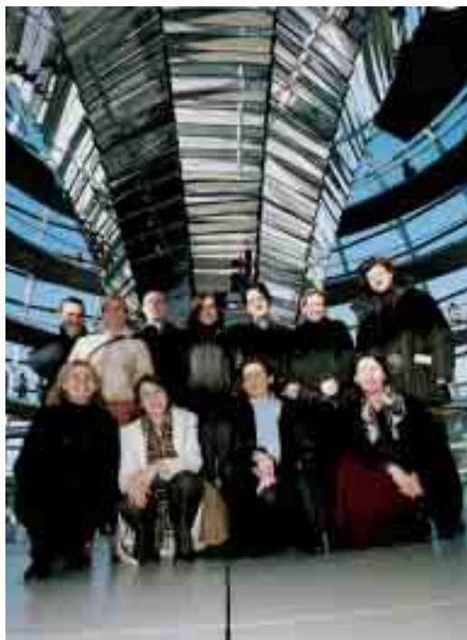
Polnische Journalisten- schüler in der Reichs- tagskuppel 2003

Zunächst absolvieren die Journalisten ein einmonatiges Seminar, das Politik, Wirtschaft und Gesellschaft in Deutschland sowie die deutsch-polnischen Beziehungen und die Europäische Union zum Inhalt hat. Auch medienpraktische Aspekte werden berücksichtigt. Das Programm wird durch Begegnungen mit wichtigen Ansprechpartnern für Journalisten in der Bundeshauptstadt und Interviews mit Persönlichkeiten des öffentlichen Lebens ergänzt. Die Teilnehmer können ihre deutschen Sprachkenntnisse in einem intensiven Fachsprachkurs vervollkommen. Wäh-