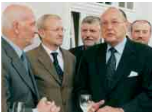
Chefredakteure in Essen mit Hans-Dietrich Genscher 2002

In Anlehnung an die Treffen deutscher und französischer Chefredakteure fördert die Stiftung seit 2001 die von der Staatskanzlei Brandenburg und dem Institut für deutsche und nordeuropäische Studien in Stettin initiierten „Treffen deutscher und polnischer Chefredakteure“. Zielgruppe sind insbesondere Chefredakteure der regionalen Tageszeitungen aus den ostdeutschen Bundesländern und den grenznahen Wojewodschaften Polens. Ziel der Treffen ist es, die Kenntnisse der Teilnehmer über das Nachbarland und dessen Politik, Wirtschaft und Gesellschaft zu vertiefen sowie durch persönliche Kontakte und den direkten Erfahrungs- und Meinungsaustausch das gegenseitige Interesse zu fördern. Das dadurch geschaffene Klima des Vertrauens trägt zu einer engeren Zusammenarbeit polnischer und deutscher Redaktionen und Journalisten bei.