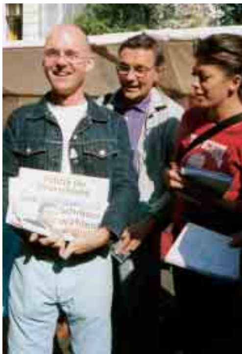
Französische Journalisten erleben den Bundestagswahlkampf 2002 aus erster Hand

In den Fortbildungsseminaren haben die Teilnehmer die Möglichkeit zum Austausch mit zahlreichen interessanten Gesprächspartnern aus allen Bereichen des öffentlichen Lebens. Daneben gibt es auch Gelegenheit zu Interviews und Besichtigungen vor Ort. Die von Beginn an positive Resonanz auf die Fortbildungsseminare zeigt sich an der anschließenden regen Berichterstattung zu Deutschland-Themen in der französischen Regionalpresse. Seit 1986 führt das Deutsch-Französische Institut in Ludwigsburg die Seminare durch. Im selben Jahr veröffentlichte die Stiftung eine Zwischenbilanz unter dem Titel „Die Bundesrepublik Deutschland im Spiegel der französischen Regionalpresse. Zehn Jahre Informations- und Fortbildungsseminare der Robert Bosch Stiftung“. Seit 1975 haben rund 150 Journalisten an den Veranstaltungen teilgenommen.