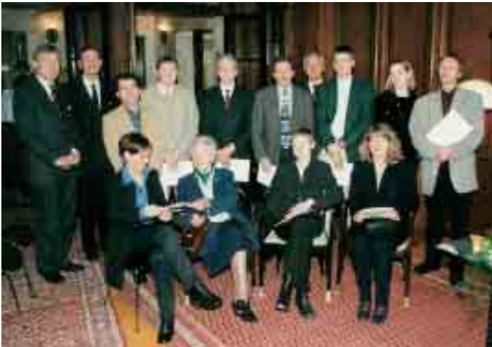
Marion Gräfin Dönhoff mit den Trägern des Journalistenpreises „Ehren- amtliches Engage- ment“ 1998 im Robert-Bosch-Haus