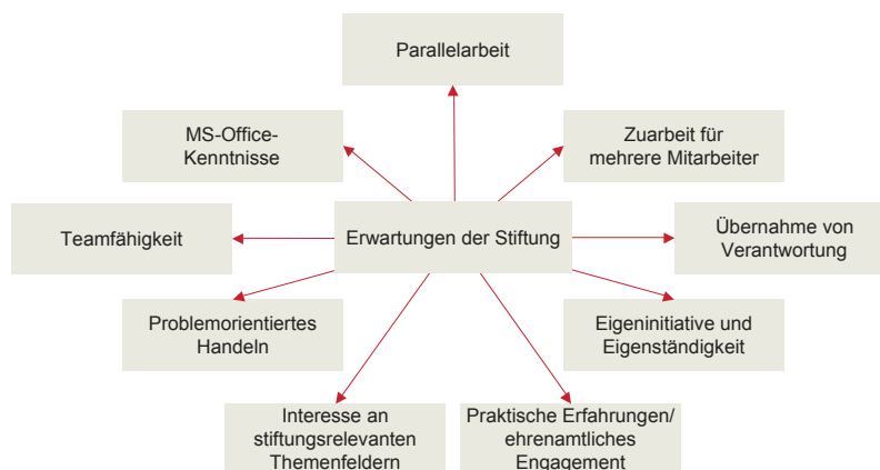
Abb. 1: Anforderungsprofil für Praktikanten/Hospitanten

Je nach Auftrag und Förderprofil können Stiftungen auch ein attraktiver Adressat für Studierende verschiedener Fachrichtungen sein, die erste Berufserfahrungen sammeln möchten. Mit der Bereitstellung von Praktikumsplätzen bieten sie jungen Menschen erste Einblicke in das Berufsfeld von Stiftungen. Viele Studiengänge sehen zwischenzeitlich ein Praxissemester vor, so dass sich die Mindestdauer von drei Monaten, die sich in der Praxis bewährt hat, auch verwirklichen lässt. Die besten Erfahrungen werden allerdings in sechsmonatigen Praktika gemacht, da hier der Praktikant Einblicke in länger dauernde Abläufe erhält und eher befähigt wird, eigenständige Vorhaben durchzuführen. Die Anforderungen an einen Praktikanten sind in Abb. 1 dargestellt. Mitunter sieht ein Studiengang auch eine bis zu zweijährige Praxisphase mit unterbrechenden kurzen Studienphasen vor, wie dies an der Katholischen Fachhochschule Mainz im Studiengang Pflegemanagement der Fall ist. Falls der Praktikant in räumlicher Nähe zur Stiftung studiert, bietet sich eine evtl. Weiterbeschäftigung als Praxisstudent für die Stiftung an.