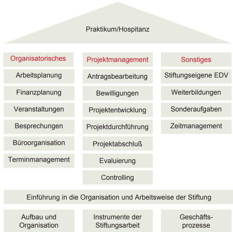
Abb. 2: Lerninhalte eines Praktikums/Hospitanz

erste Erfahrungen zu sammeln, und die abschließenden zwei Monate geeignet sind, eigenständige kleinere Projekte durchzuführen. Je nach Aufgabenstellung empfiehlt sich auch eine ggf. längere Vertragslaufzeit. Mit diesem Personalinstrument können Hospitant und Stiftung Erfahrungen miteinander sammeln, die je nach Personalausstattung und -situation