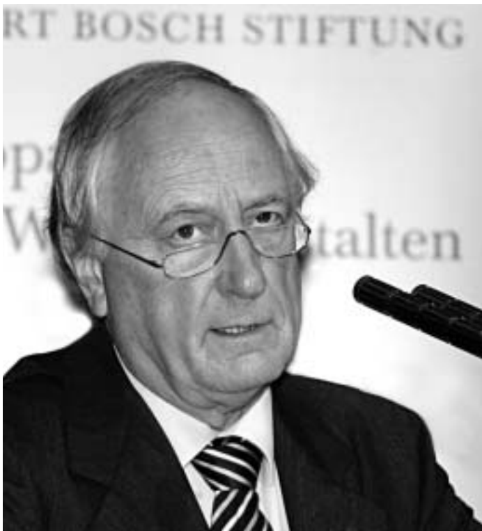
Heinrich August Winkler