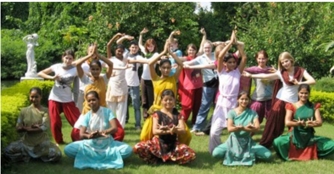
The student exchange group Ostalb Gymnasium Bopfingen / School of Dance and Music Nav Sadhana.

The Indian traffic is certainly one of the most exciting things that we experienced during our time in India. Single lanes and traffic lights are only marginally respected in India. We had the feeling that the horn is rather the most important part of the vehicle because they can be heard on the road constantly. Thus, we saw real virtuoso on the streets of India, trying to carve their way through their honking horns – the traffic sounds did not seem to come to an end even at night.