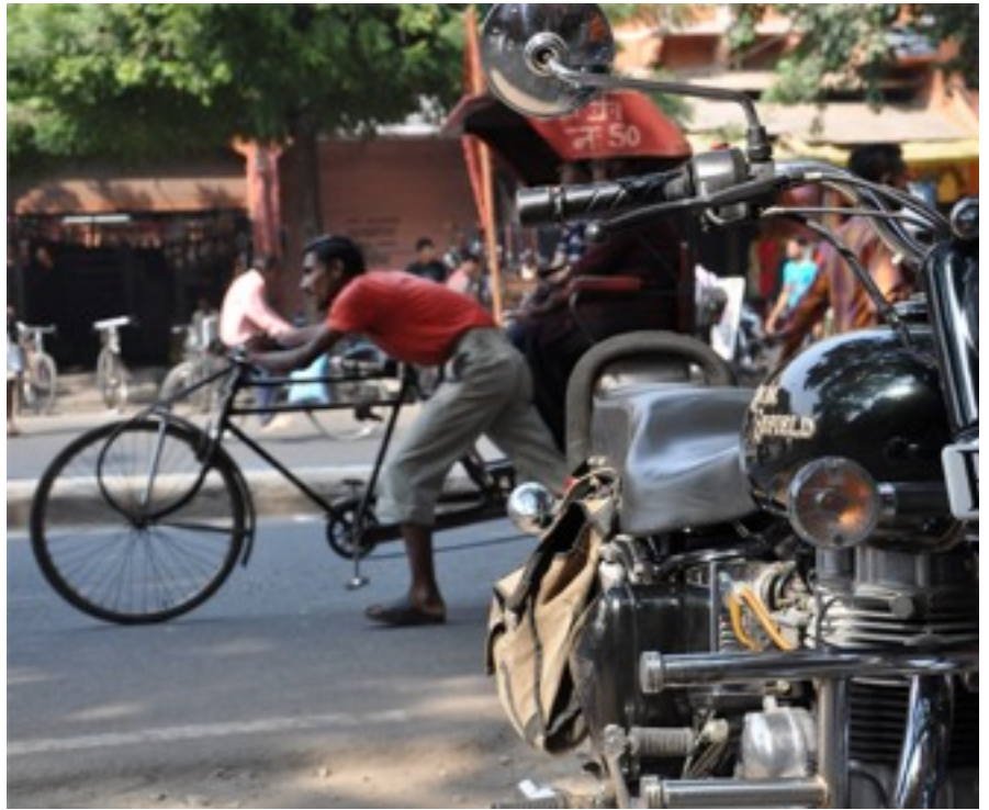
A Royal Enfield (right side) in the streets of Jaipur: A symbol for Globalization in India.

Ein erster Schritt hierzu ist die Einbindung eines internationalen Schüleraustausches in das bereits bestehende Konzept für die Berufsorientierung. Die Be-