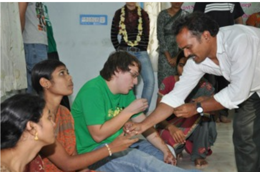
A scene from the student's playing on the daily life in the Child Guidance Center.