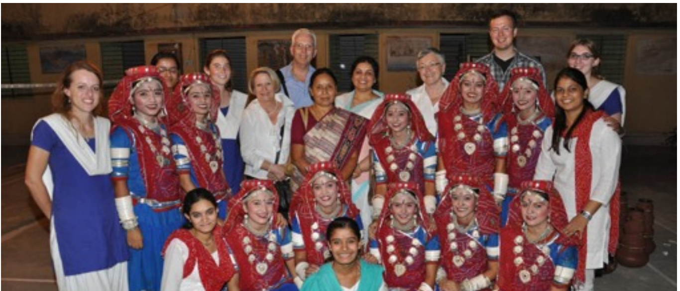
The dancers from Banasthali, the exchange students from the University of Education Weingarten, and the delegation in Banasthali.

In our stay here we found many advantages of this respectful relation, but we also want to mention some disadvantages as we saw teachers utilizing fully their position. We felt that in many ways it is a one way respect relationship and we are of the opinion that a student has to be respected to bring the best results.