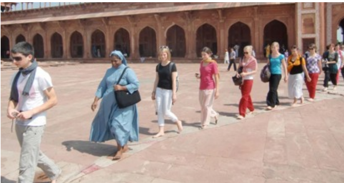
The student exchange group Ostalb Gymnasium Bopfingen in Fatehpur Sikri.