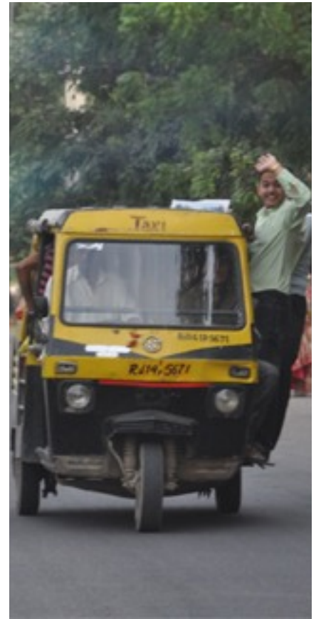
The way of driving really was amazing in the huge Indian cities.

At this point we want to thank the escorts, the facilities and schools exceedingly for their dedication with which they get involved in this project. Who provides this type of encounter to young people, offers an invaluable contribution to their personal development.