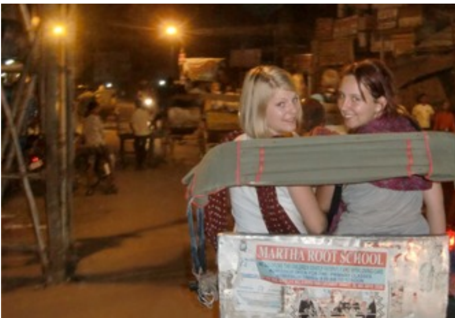
The Indian traffic was one of the most impressive aspects of Indian life for the German students.