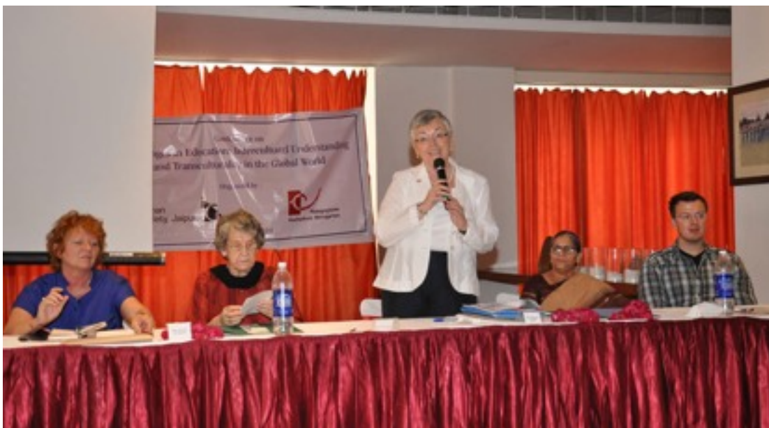
The students from Emmendingen were able to take part on the Conference on Challenges in Education.

It is not just about wealth, education and power, but also, as the basis for their future, to learn more about the world open-minded and open-hearted, which is essential for a future better world.