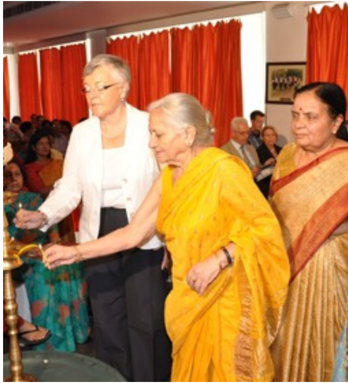
The introduction of the conference on Challenges in Education, which was held in Jaipur on October 30th.

Insgesamt sind die Tandems durch die gemeinsame Erfahrung, das gemeinsame Arbeiten und die gemeinsame Problemlö-