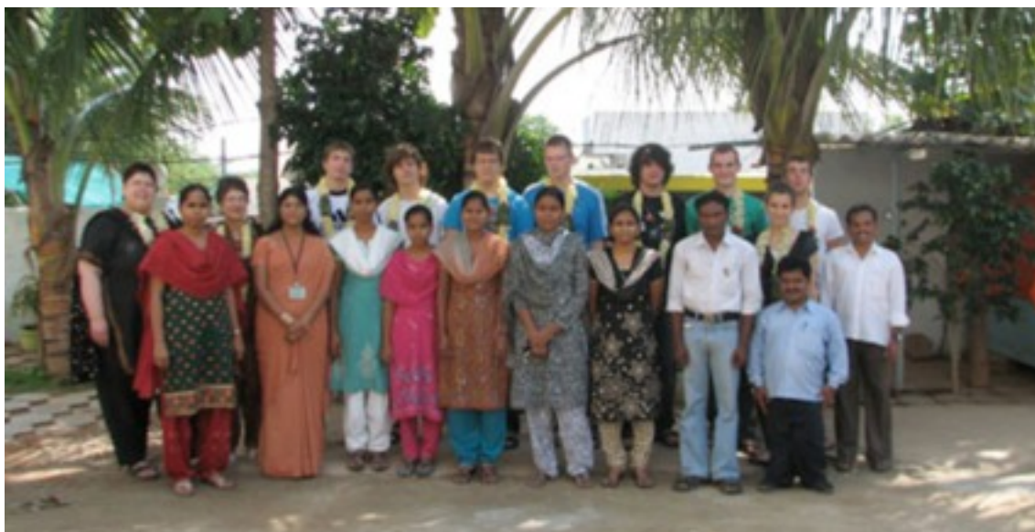
The student exchange group Occupational High School Mosbach / CGC Hyderabad.

Furthermore, the students always heartily did their work and German students as well as teachers were always welcome to ask questions or ask for help.