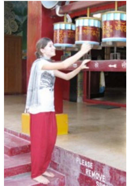
A student with some prayer wheels.

The very last evening we spent together with all Indian students, teachers, nurses and pastors with a nice dinner outside in the balmy winter night. For the last time, we enjoyed the Indian food and especially the spending time with our friends.