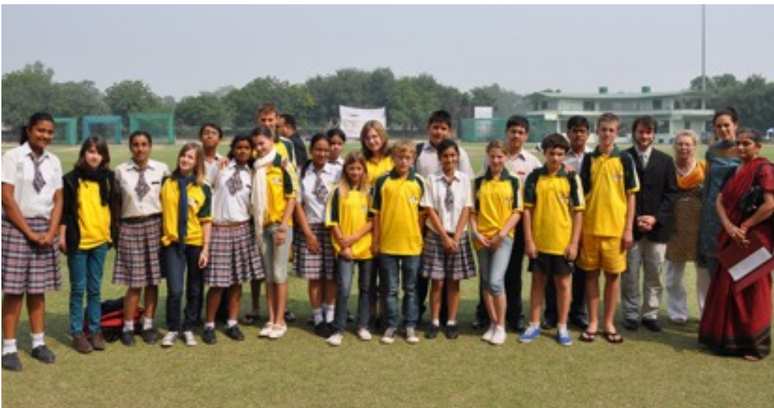
The student exchange group Markgrafen Realschule Emmendingen / Seedling Public School Jaipur.

Wir hoffen, dass durch diesen Austausch ein kleiner Teil davon erreicht werden kann. Selbstvertrauen, Eigenständigkeit und Selbstbewusstsein ist nicht nur für die SchülerInnen wichtig, um sich in der Welt zurecht zu finden, um fit fürs Leben zu sein.