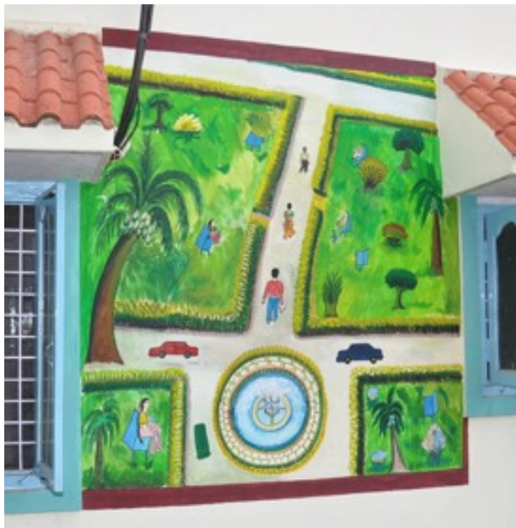
A big painting on one of the walls of the CGC.

Die Schüler wohnten während des Aufenthaltes in Indien im Happy Home des CGCs, und hatten somit die Möglichkeit die Arbeit und den Alltag des Projektes hautnah mitzerleben. Neben der Arbeit im CGC lernten die Schüler die Stadt Hyderabad und ihre Sehenswürdigkeiten kennen, wobei insbesondere die Buddha Statue und das Golconda Fort eindrucksvoll waren. Außerdem hatte die Gruppe die Gelegenheit, das Divali, eines der höchsten und am meisten gefeierten indischen Feste, das mit Silvester zu vergleichen ist, miterleben.