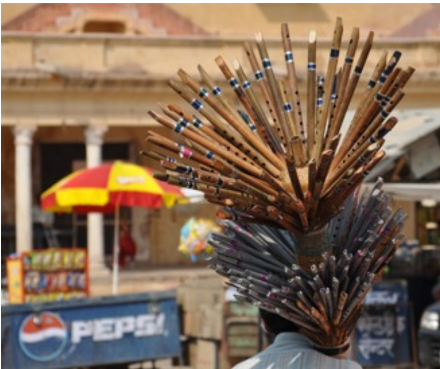
Indian salesmen always agglomerate when European people are in sight.

In Indien angekommen, fanden zunächst Gespräche mit der Schulleitung statt, in denen der Ablauf des Projekts nochmals grundsätzlich geklärt wurde. Anschließend wurde mit den gesamten SchülerInnen das Projektvorgehen weiter geplant und diskutiert. Die bereits im Vorfeld in Deutschland erarbeiteten Materialien, wie z.B. Frage-/ Interviewbögen für die Betriebe, wurden gemeinsam überarbeitet. Von essenzieller Bedeutung war das Vorwissen der indischen Schüler über die betriebliche Realität Indiens, aber auch das Wissen, um indische Konventionen.